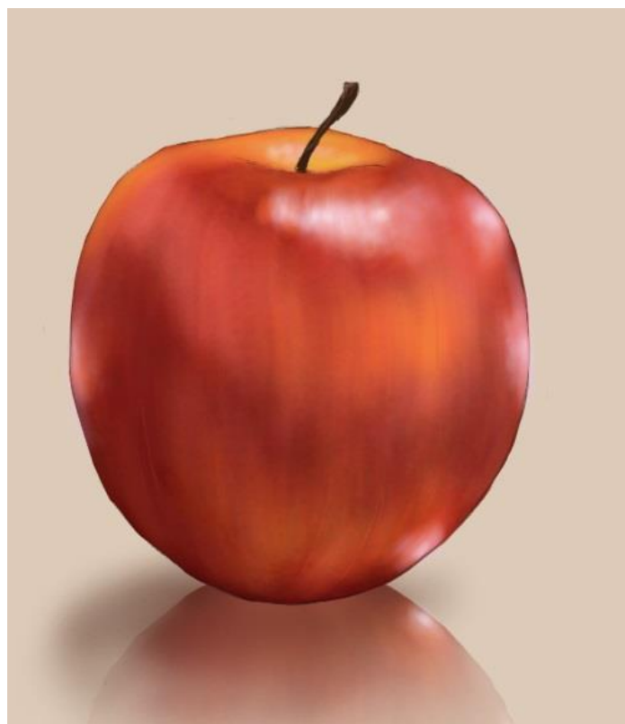
イラスト 高津達広